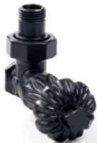
Art zawór termostatyczny