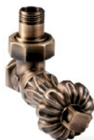
Art zawór termostatyczny

By podłączyć grzejnik należy na powrocie zamontować zawór odcinający.